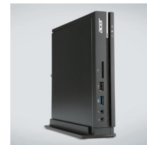
専用スタンドで縦置き