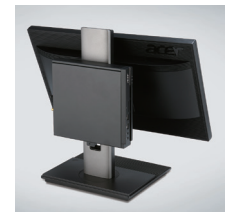
付属のVESAキットで 背面設置