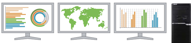
4ポート (DisplayPortポートx2, HDMIポート, VGAポート)のうち任意の3ポートからの同時出力に対応

標準搭載の4ポートのうち、任意の3ポートからの同時出力に対応。3台のモニターにそれぞれ異なる情報を表示できるため、 効率的に作業ができます 。