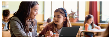
*G Suite for Educationの利用にはお申込み・登録が必要です。

教育機関向け無料のGoogleアプリセットで、Gmail、Googleドライブ™、オフィスソフトのドキュメントやスプレッドシートなど、学校全体が一緒に使えるサービスです。カレンダーや授業の動画・資料などの共有、リアルタイムでファイルの作成・共同編集も可能。クラウドのため、拡張もラクラク。