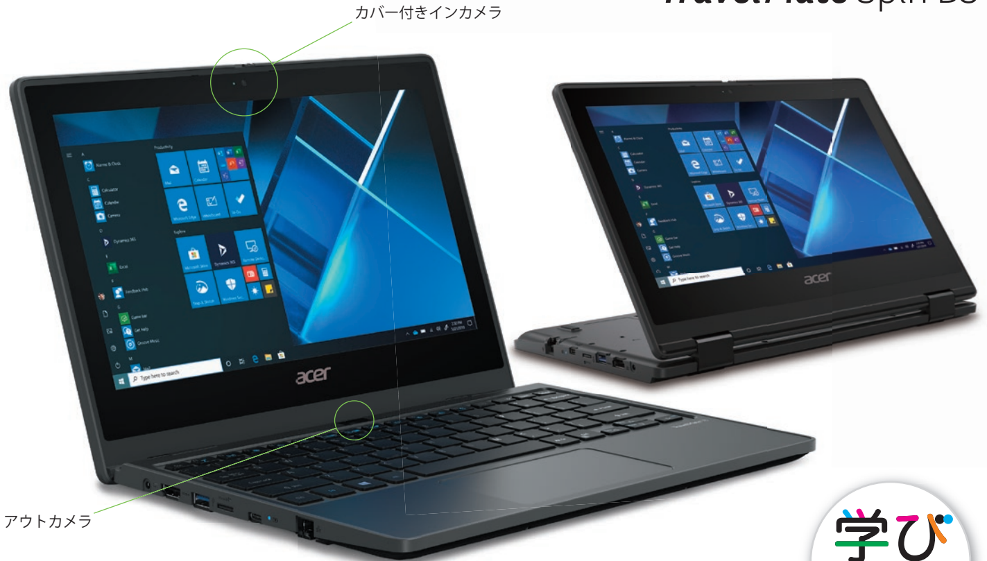
カバー付きインカメラ