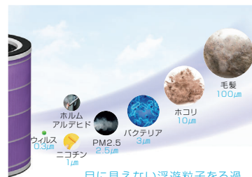
目に見えない浮遊粒子をろ過

円筒形のボディ360°から空気を吸引し、4層構造のHEPAフィルターで空気中のホコリなどをキャッチ。マイナスイオン機能も搭載*1。