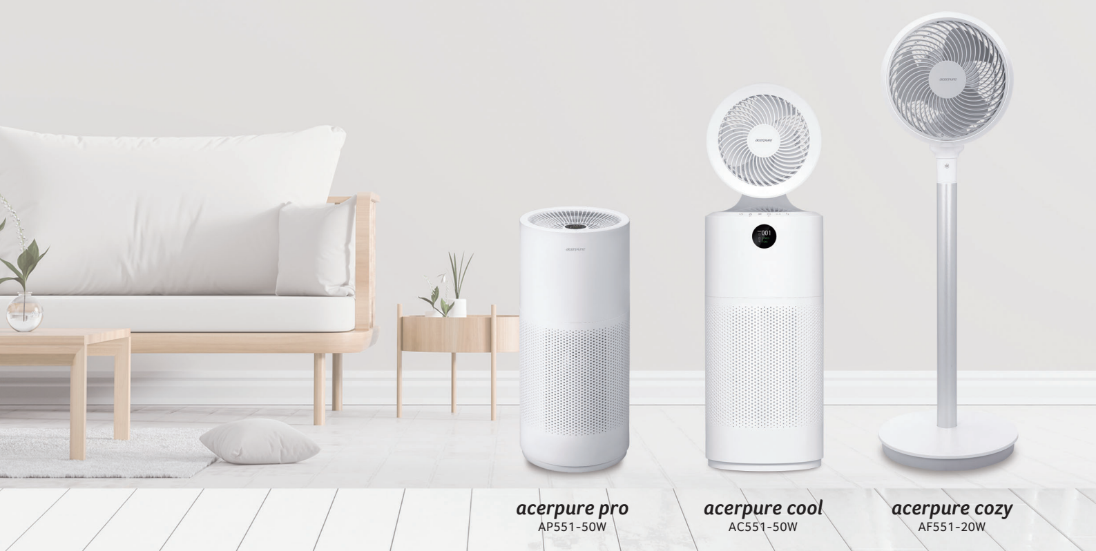
acerpure pro AP551-50W